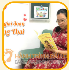
Mang thai hạnh phúc