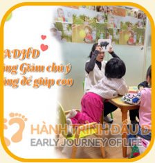
Tăng động giảm chú ý