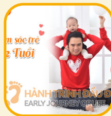
Chăm sóc trẻ 1-2 tuổi