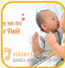
Chăm sóc trẻ 0-1 tuổi