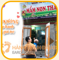
Để con không bị bạo hành ở nơi gửi trẻ