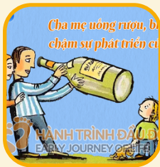
Cha mẹ uống rượu, bia chậm sự phát triển của trẻ